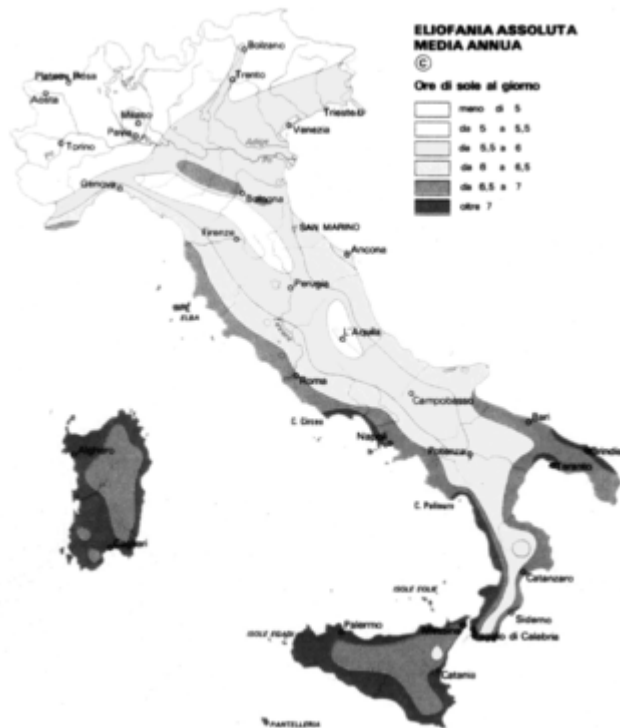
Figura 2 - Mappa di eliofania assoluta media annua.